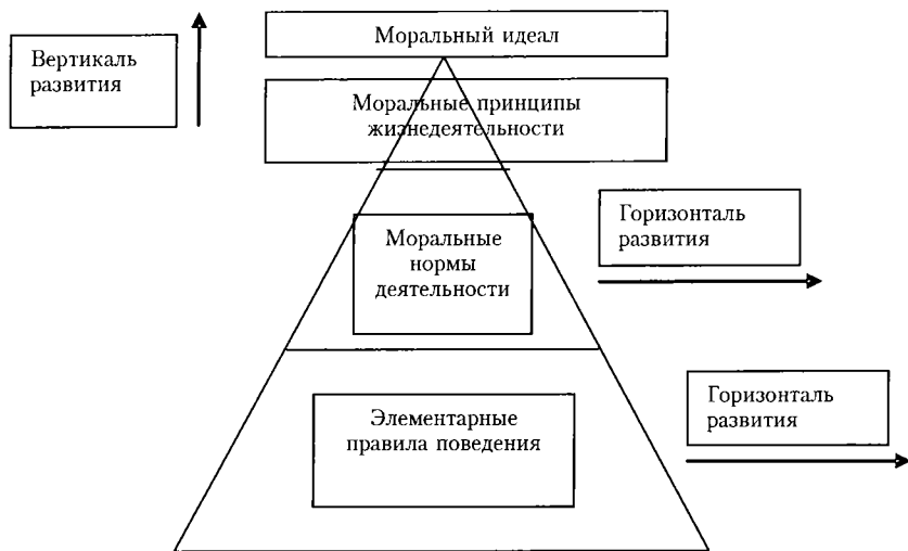
Система моральных требований

достоинство человека. Тактичность проявляется в умении не задавать тупиковых вопросов, в искусстве импровизации и в чувстве меры во всем. Скромность, в отличие от ее обыденного понимания как робости, застенчивости, неуверенности в себе, представляет собой умение человека быть самим собой, не играть не свойственной ему роли, всегда сохранять свою индивидуальность и достоинство. В основе этикетной поведенческой культуры лежит принцип неравноценности достоинств, принцип иерархии социальных статусов, который задает вертикаль отношений и делит людей на вышестоящих и нижестоящих. Существуют разные виды этикета: придворный, дипломатический, религиозный, воинский, светский, деловой. Оба вида поведенческой культуры востребованы сегодня в разных видах отношений, облагораживают эти отношения, но предполагают постоянный процесс их воспитания и коррекции в соответствии с меняющимися социальными условиями.